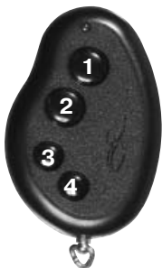
Рис. 1. Нумерация кнопок брелока.

Управление работой системы осуществляется по командам четырехкнопочного радиобрелока. Дальность действия брелока порядка 30 м. При уменьшении дальности действия проверьте напряжение батареи в брелоке и при необходимости замените ее (см. раздел "Замена батареи в брелоке"). Распознавание транспондера происходит после того, как брелок подносится вплотную к месту установки антенны.